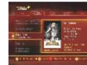
Hauptübersicht: Mit den Cursor-Tasten zappen Sie sich bequem durch Genres und Filme.

Der Dienst bietet eine wöchentlich aktualisierte Auswahl aus dem umfangreichen Filmangebot von PREMIERE. Die Filme werden auf die Festplatte des iPDR-9800 gespielt und in mehreren Kategorien übersichtlich abgelegt.