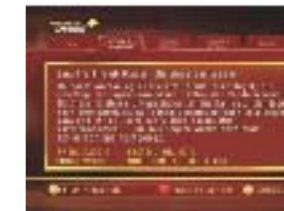
Film-Infos: Zeigt Inhalt und Ausstattung des Films.