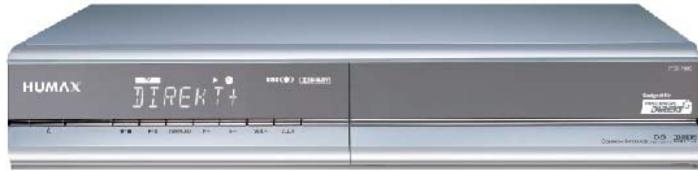
iPDR-9800 | Digital-Rekorder

Mit nur einem Gerät digitale TV- und Radioprogramme empfangen und aufnehmen. Gleichzeitig eine Sendung in digitaler Qualität aufzeichnen und eine andere live verfolgen. Festplatten-Receiver der neuen Generation mit insgesamt 160 GB Speicherkapazität. Circa eine Hälfte der Festplatte zur freien Verfügung mit einer Aufnahmekapazität von ca. 40 Stunden Programm. Die andere Hälfte für PREMIERE DIREKT+: Bis zu 30 Spielfilme verschiedener Genres inklusive Vollerotik, jederzeit - gegen Gebühr - einzeln abrufbar. Mit der Timeshift-Funktion das laufende Programm ganz einfach anhalten und später nahtlos weiterverfolgen, ohne eine wichtige Szene zu verpassen. Und so funktioniert PREMIERE DIREKT+: Einfach rund um die Uhr per Telefon, SMS oder Internet bestellen, und Ihr Wunschfilm wird sofort für 24 Stunden freigeschaltet. Sie bestimmen, wann Sie einschalten möchten.