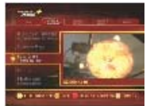
Vorschau: Hier können Sie sich vor Bestellung den Trailer anschauen.